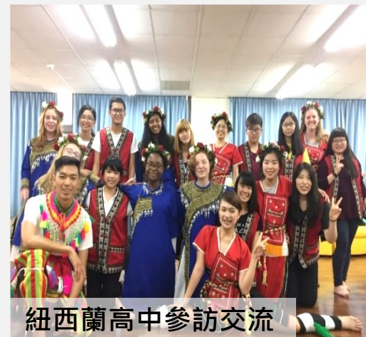
紐西蘭高中參訪交流