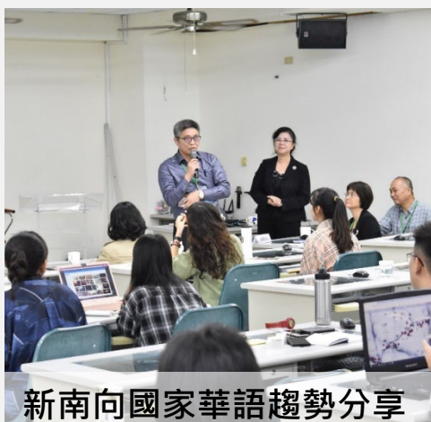
新南向國家華語趨勢分享