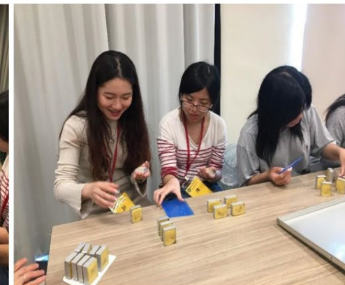
郭元益糕餅博物館：傳統婚嫁節慶習俗及鳳梨酥製作體驗