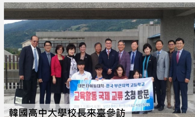
韓國高中大學校長來臺參訪