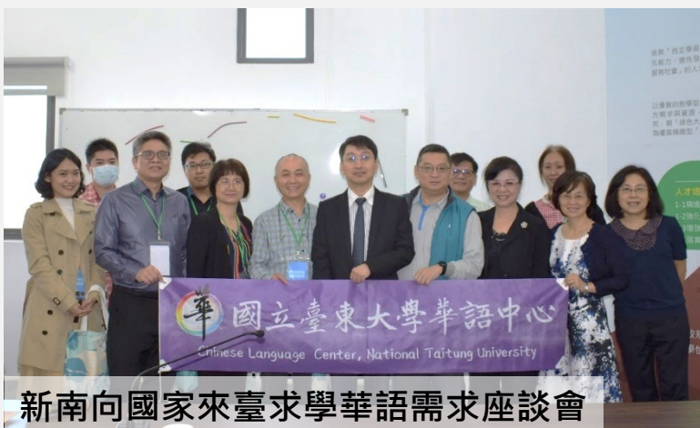
新南向國家來臺求學華語需求座談會